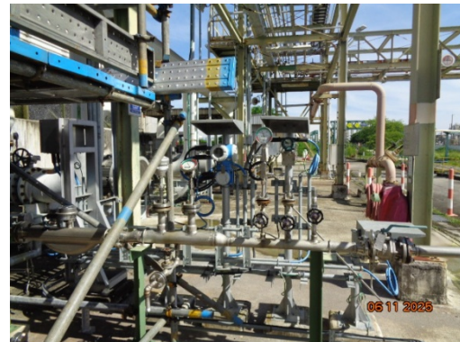
รูปที่ 3.2-48 Pressure Relief Valve