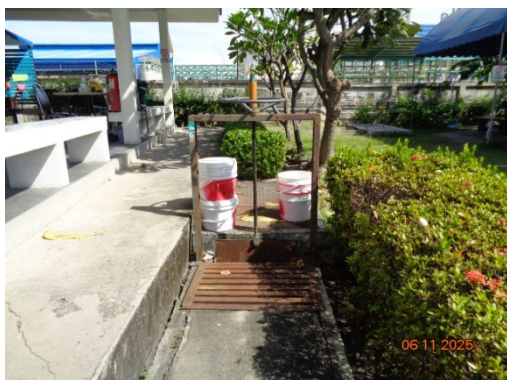
รูปที่ 3.2-45 วัสดุดูดซับของเหลวที่หกแล้วไหล