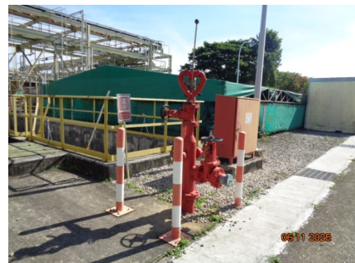
รูปที่ 3.2-34 Fire Hydrant

รูปที่ 3.2 ภาพถ่ายประกอบการปฏิบัติตามมาตรการป้องกันและแก้ไขผลกระทบ สิ่งแวดล้อม โครงการโรงงานผลิต Polyethylene Terephthalate (PET) (ระยะดำเนินการ) บริษัท ไทย เพ็ท เรซิน จำกัด (ต่อ)