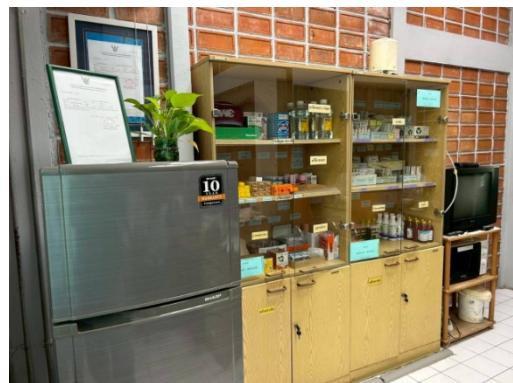
รูปที่ 3.2-39 ห้องพยาบาลและอุปกรณ์ปฐมพยาบาล

รูปที่ 3.2 ภาพถ่ายประกอบการปฏิบัติตามมาตรการป้องกันและแก้ไขผลกระทบ สิ่งแวดล้อม โครงการโรงงานผลิต Polyethylene Terephthalate (PET) (ระยะดำเนินการ) บริษัท ไทย เพ็ท เรซิน จำกัด (ต่อ)