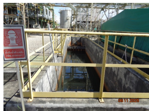
รูปที่ 3.2-10 Oil Separator

รูปที่ 3.2 ภาพถ่ายประกอบการปฏิบัติตามมาตรการป้องกันและแก้ไขผลกระทบ สิ่งแวดล้อม โครงการโรงงานผลิต Polyethylene Terephthalate (PET) (ระยะดำเนินการ) บริษัท ไทย เพ็ท เรซิน จำกัด (ต่อ)