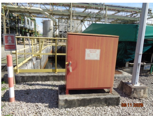
รูปที่ 3.2-33 Fire Hose Box