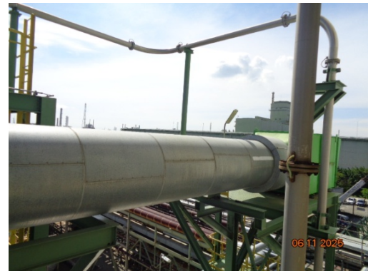
รูปที่ 3.2-8 Cyclone ชุดที่ 6 MC-1594