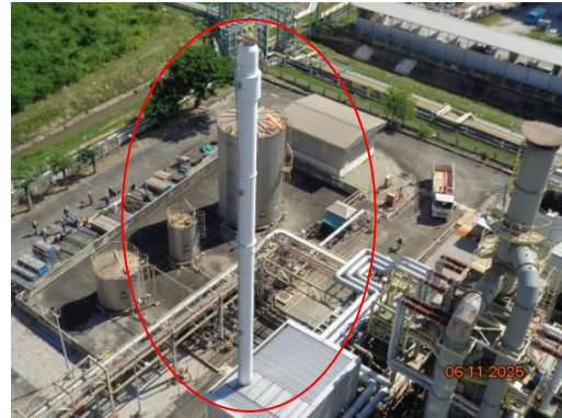
รูปที่ 3.2-2 ปล่องระบายอากาศ HTM Heater ชุดที่ 2 (F-1901-2)