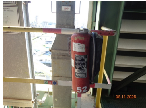
รูปที่ 3.2-36 ถังดับเพลิง