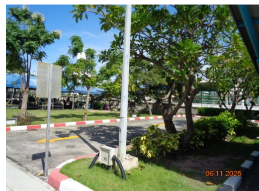
รูปที่ 3.2-40 พื้นที่สีเขียว

รูปที่ 3.2 ภาพถ่ายประกอบการปฏิบัติตามมาตรการป้องกันและแก้ไขผลกระทบ สิ่งแวดล้อม โครงการโรงงานผลิต Polyethylene Terephthalate (PET) (ระยะดำเนินการ) บริษัท ไทย เพ็ท เรซิน จำกัด (ต่อ)