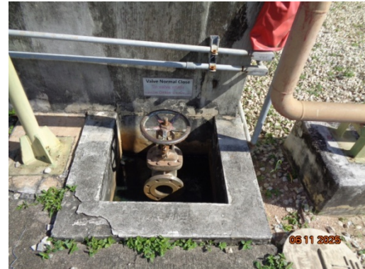
รูปที่ 3.2-42 Block Valve