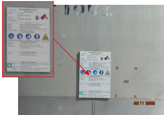
รูปที่ 3.2-28 การติดป้าย SDS ของสารเคมี

รูปที่ 3.2 ภาพถ่ายประกอบการปฏิบัติตามมาตรการป้องกันและแก้ไขผลกระทบต่อสิ่งแวดล้อม โครงการโรงงานผลิต Polyethylene Terephthalate (PET) (ระยะดำเนินการ) บริษัท ไทย เพ็ท เรซิน จำกัด (ต่อ)