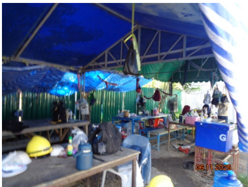
รูปที่ 3.1-7 พื้นที่พักผ่อนชั่วคราว/ รับประทานอาหาร