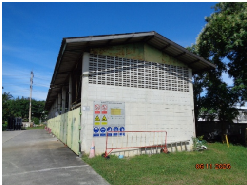
รูปที่ 3.2-25 อาคารเก็บกากของเสีย