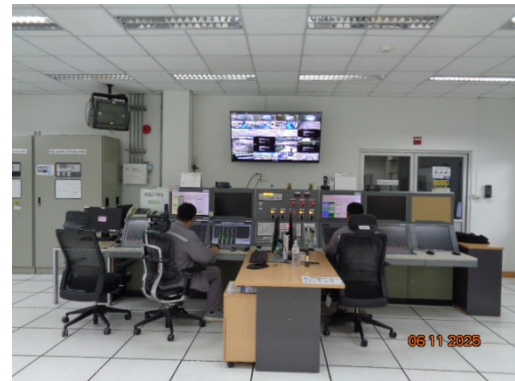
รูปที่ 3.2-44 Distributed Control System (DCS)