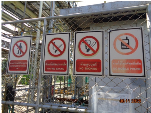
รูปที่ 3.2-47 ป้ายเตือน และระดับเพลิง บริเวณท่อนส่งก๊าซธรรมชาติ