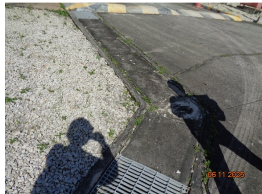
รูปที่ 3.2-26 รางระบายน้ำฝน