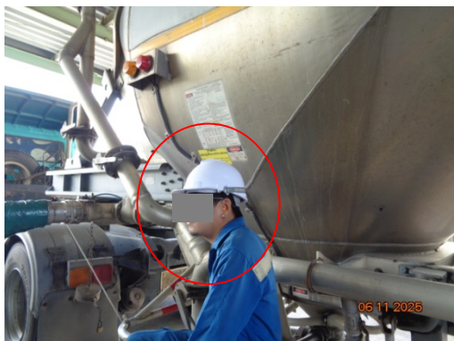
รูปที่ 3.2-19 พนักงานสวมใส่อุปกรณ์ป้องกันเสียง