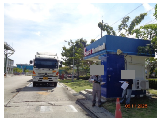
รูปที่ 3.2-22 พื้นที่ขังน้ำหน้ารถ

รูปที่ 3.2 ภาพถ่ายประกอบการปฏิบัติตามมาตรการป้องกันและแก้ไขผลกระทบ สิ่งแวดล้อม โครงการโรงงานผลิต Polyethylene Terephthalate (PET) (ระยะดำเนินการ) บริษัท ไทย เพ็ท เรซิน จำกัด (ต่อ)