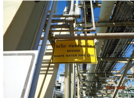
รูปที่ 3.2-12 ป้ายเตือนบริเวณแนวท่อขนส่งน้ำเสีย