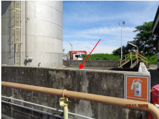
รูปที่ 3.2-41 คั่นคอนกรีตรอบพื้นที่เก็บสารเคมี