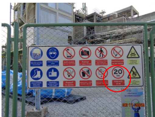
รูปที่ 3.2-21 ป้ายจำกัดความเร็ว