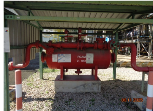
รูปที่ 3.2-32 ระบบโฟมดับเพลิง