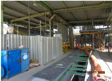
รูปที่ 3.1-2 การกั้นแนวรั้วบริเวณ โดยรอบด้วย Metal sheet