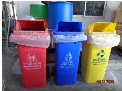
รูปที่ 3.2-24 ถังขยะภายในพื้นที่โครงการ