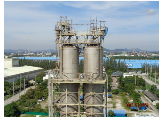
รูปที่ 3.2-6 Cyclone ชุดที่ 3 และ 4 (MC-1614 และ MC-1624)