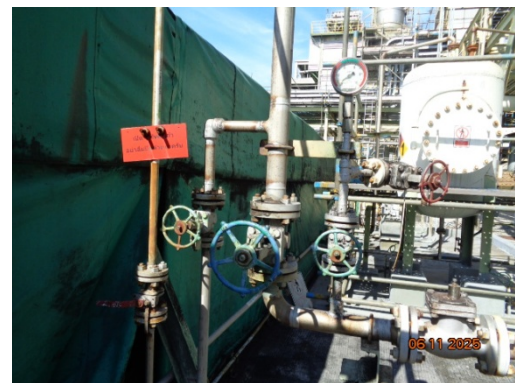
รูปที่ 3.2-14 ระบบ Pressure Gauge