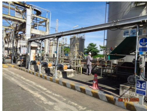
รูปที่ 3.2-49 เจ้าหน้าที่เดินตรวจสอบการรั่วไหลและเหตุการณ์ผิดปกติรอบถังกักเก็บ และแนวท่อนส่งโมโนเอทรีลีนไกลคอล