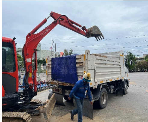
รูปที่ 3.1-1 การคลุมผ้าใบหลังกระบะรถบรรทุก