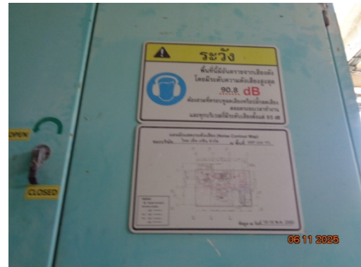
รูปที่ 3.2-18 ป้ายเตือนในบริเวณที่มีเสียงดัง