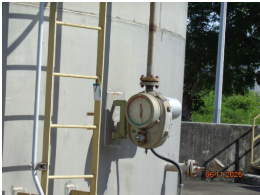
รูปที่ 3.2-43 อุปกรณ์วัดระดับสารเคมี (Level Indicator, Level Gauge)