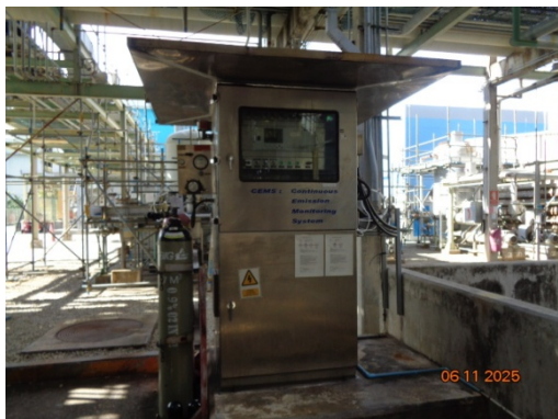
รูปที่ 3.2-3 Continuous Emission Monitoring System, CEMS