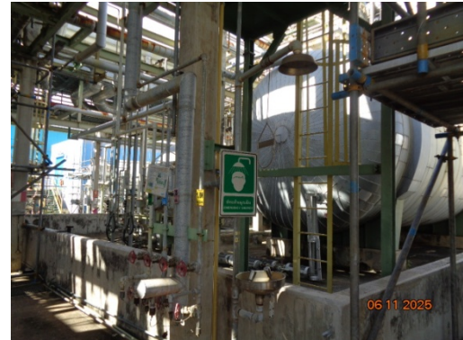
รูปที่ 3.2-30 ฝักบัวและอ่างล้างตาฉุกเฉิน