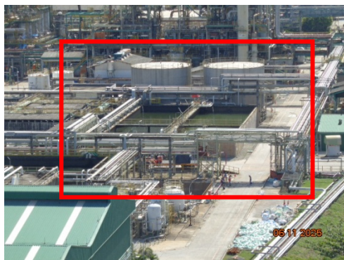
รูปที่ 3.2-37 บ่อน้ำสำรองในการดับเพลิง ของบริษัท จีซี-เอ็ม พีทีเอ จำกัด