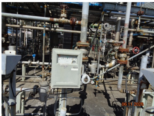
รูปที่ 3.2-13 ระบบ Flow Meter