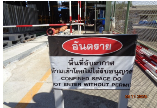
รูปที่ 3.1-6 ขอบเขตและรั้วกันบริเวณพื้นที่ก่อสร้าง