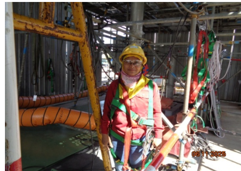
รูปที่ 3.1-3 คนงานสวมใส่อุปกรณ์คุ้มครอง ความปลอดภัยส่วนบุคคล