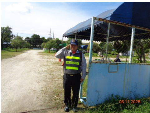
รูปที่ 3.1-4 เจ้าหน้าที่อำนวยความสะดวก และดูแลการเข้า-ออกโครงการ