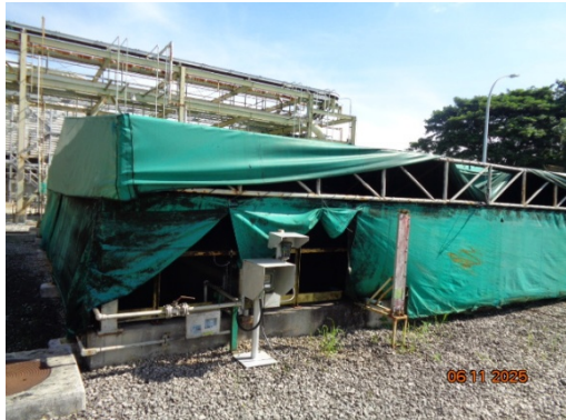
รูปที่ 3.2-11 Neutralization Pond