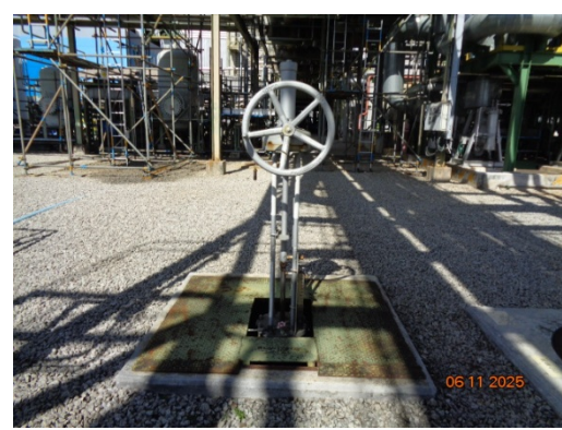
รูปที่ 3.2-16 วาล์วตัดแยกระบบบำบัดน้ำเสีย

รูปที่ 3.2 ภาพถ่ายประกอบการปฏิบัติตามมาตรการป้องกันและแก้ไขผลกระทบ สิ่งแวดล้อม โครงการโรงงานผลิต Polyethylene Terephthalate (PET) (ระยะดำเนินการ) บริษัท ไทย เพ็ท เรซิน จำกัด (ต่อ)