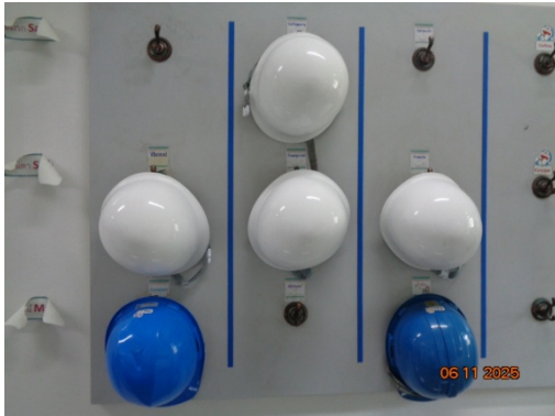
รูปที่ 3.2-29 อุปกรณ์คุ้มครองความปลอดภัย ส่วนบุคคล