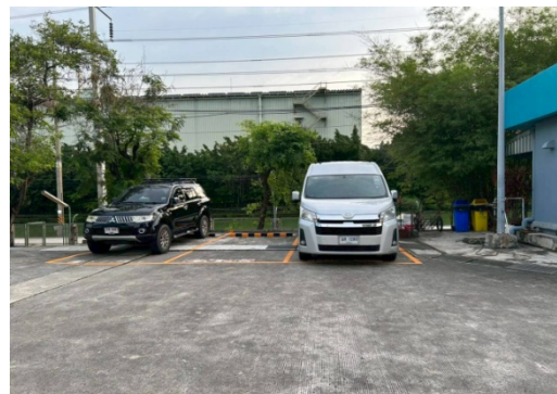
รูปที่ 3.2-38 ยานพาหนะสำหรับรับ-ส่งผู้ป่วย