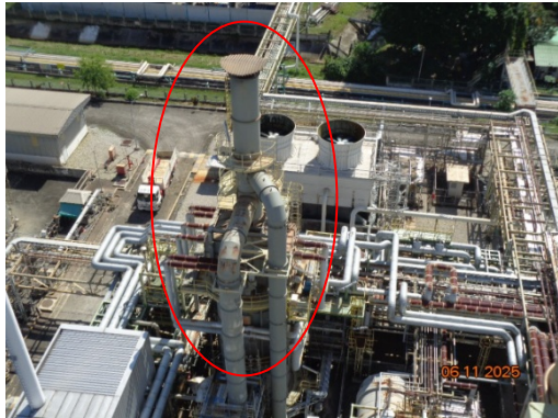
รูปที่ 3.2-1 ปล่องระบายอากาศ HTM Heater ชุดที่ 1 (F-1901)