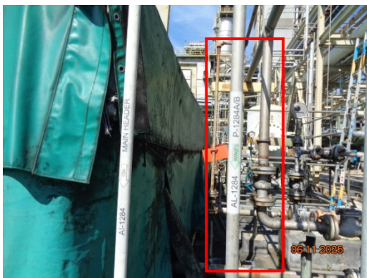
รูปที่ 3.2-15 ระบบท่อ Minimum Flow Line