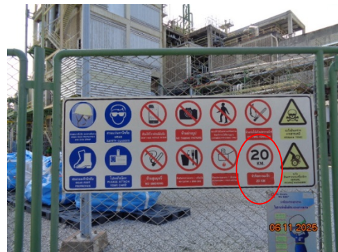
รูปที่ 3.1-5 ป้ายจำกัดความเร็ว บริเวณพื้นที่โครงการ

รูปที่ 3.1 ภาพถ่ายประกอบการปฏิบัติตามมาตรการป้องกันและแก้ไขผลกระทบสิ่งแวดล้อม โครงการโรงงานผลิต Polyethylene Terephthalate (PET) (ระยะก่อสร้าง) บริษัท ไทย เพ็ท เรซิน จำกัด (ต่อ)