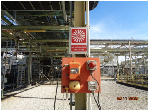
รูปที่ 3.2-35 Fire Alarm