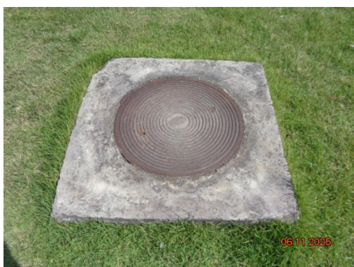
รูปที่ 3.2-9 Septic Tank