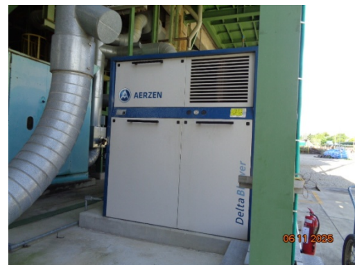
รูปที่ 3.2-20 ที่ครอบเครื่องจักรป้องกันเสียง