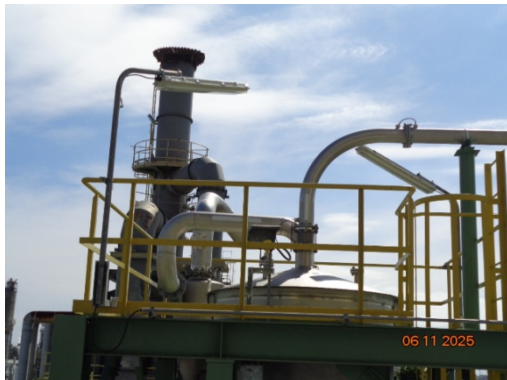
รูปที่ 3.2-7 Cyclone ชุดที่ 5 MC-1462