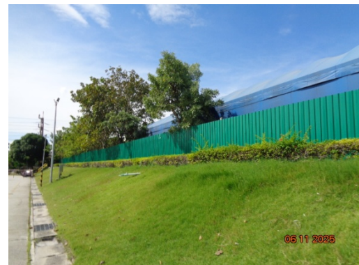
รูปที่ 3.2-40 พื้นที่สีเขียว (ต่อ)

รูปที่ 3.2 ภาพถ่ายประกอบการปฏิบัติตามมาตรการป้องกันและแก้ไขผลกระทบ สิ่งแวดล้อม โครงการโรงงานผลิต Polyethylene Terephthalate (PET) (ระยะดำเนินการ) บริษัท ไทย เพ็ท เรซิน จำกัด (ต่อ)