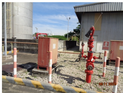
รูปที่ 3.2-50 Fire Hydrant บริเวณท่อนส่งก๊าซธรรมชาติ

รูปที่ 3.2 ภาพถ่ายประกอบการปฏิบัติตามมาตรการป้องกันและแก้ไขผลกระทบ สิ่งแวดล้อม โครงการโรงงานผลิต Polyethylene Terephthalate (PET) (ระยะดำเนินการ) บริษัท ไทย เพ็ท เรซิน จำกัด (ต่อ)