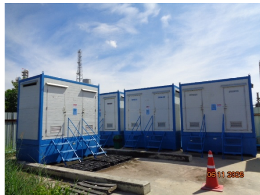
รูปที่ 3.1-8 ห้องน้ำ-ห้องส้วม สำหรับคนงานก่อสร้าง

รูปที่ 3.1 ภาพถ่ายประกอบการปฏิบัติตามมาตรการป้องกันและแก้ไขผลกระทบสิ่งแวดล้อม โครงการโรงงานผลิต Polyethylene Terephthalate (PET) (ระยะก่อสร้าง) บริษัท ไทย เพ็ท เรซิน จำกัด (ต่อ)