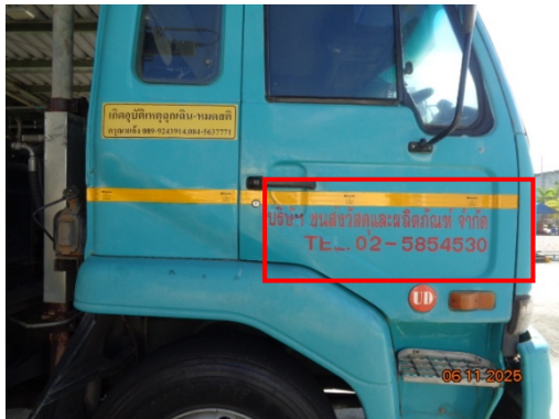
รูปที่ 3.2-23 การติดป้ายชื่อและหมายเลขโทรศัพท์ ที่รถขนส่งผลิตภัณฑ์และสารเคมี