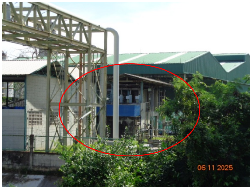
รูปที่ 3.2-17 ระบบบำบัดน้ำเสียเดิมของโครงการ