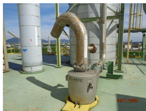
รูปที่ 3.2-4 Cyclone ชุดที่ 1 MC-1512

รูปที่ 3.2 ภาพถ่ายประกอบการปฏิบัติตามมาตรการป้องกันและแก้ไขผลกระทบ สิ่งแวดล้อม โครงการโรงงานผลิต Polyethylene Terephthalate (PET) (ระยะดำเนินการ) บริษัท ไทย เพ็ท เรซิน จำกัด