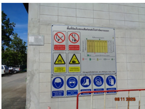
รูปที่ 3.2-27 ป้ายเตือนอันตรายต่างๆ