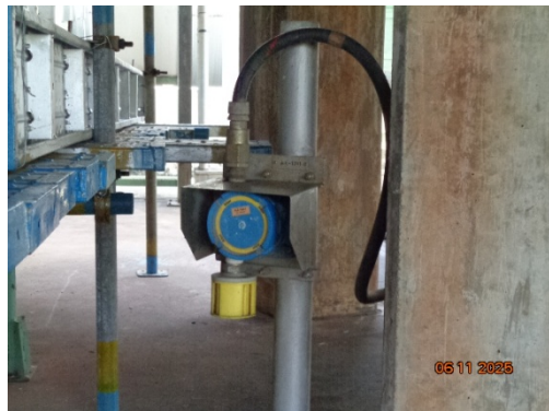
รูปที่ 3.2-31 Gas Detector