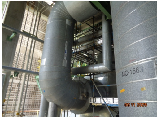
รูปที่ 3.2-5 Cyclone ชุดที่ 2 MC-1563